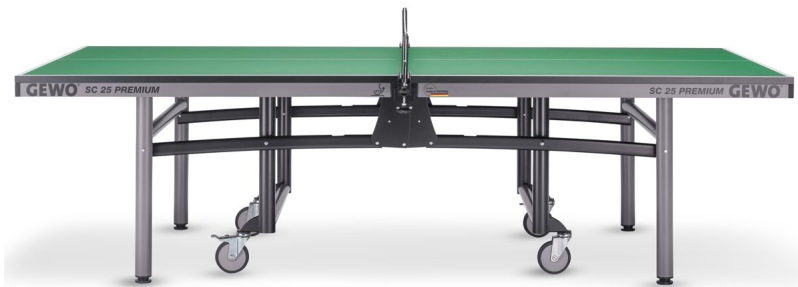
GEWO SC 25 Premium grün