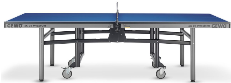
GEWO SC 25 Premium blau