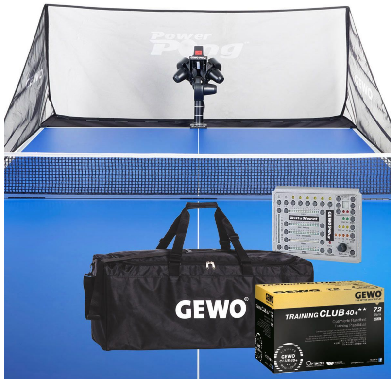
TT-GEWO ROBOTER SET DELTA