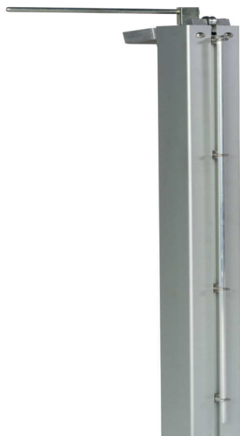
Haspo Tennispfosten 500