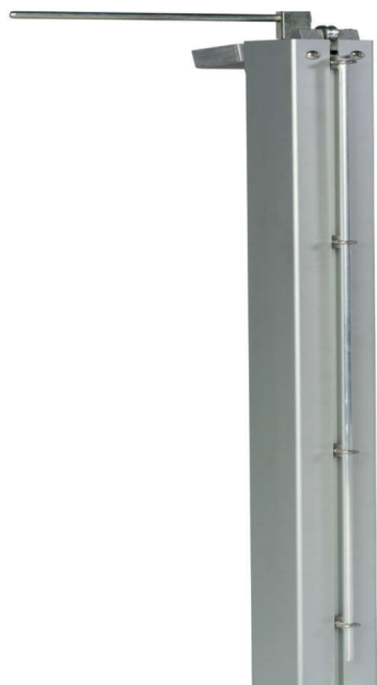
Haspo Tennisposten 500