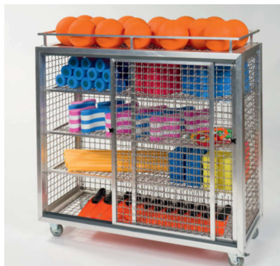
Haspo Gerätewagen Maxi 430