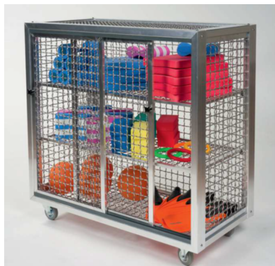
Haspo Gerätewagen Maxi 429, FTHZ000429