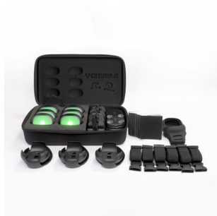
A-Champs ROXPro X Set 6er Koffer