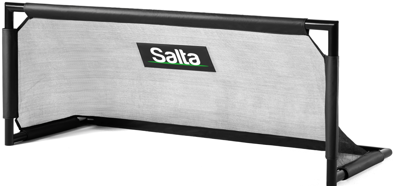
Salta Fußballtor 5120-V1