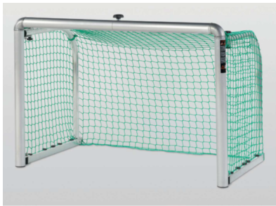
Haspo Minitor klappbar 152945