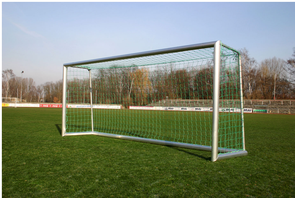
HELO Sports Jugendtor B00213