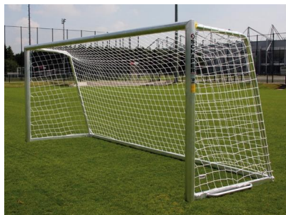
Schäper Jugendtor 27SAM1R3