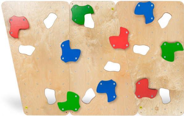
Erzi Kletterwand Junior ER44016