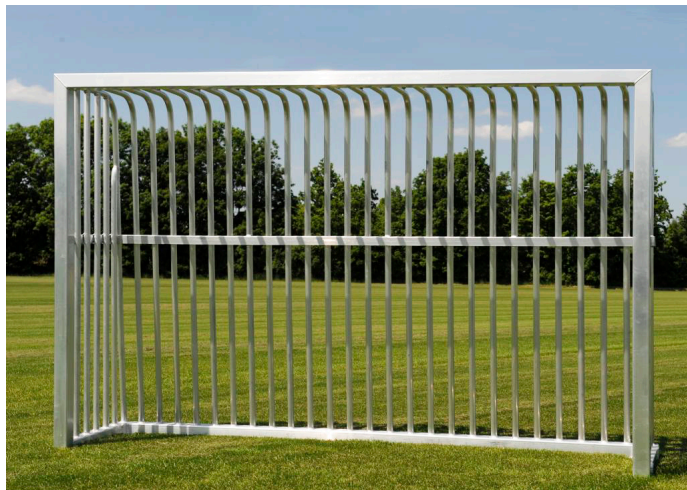
JOBA Bolzplatztor 3x2m 50360