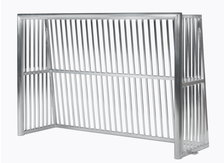
Haspo Bolzplatztor 1061