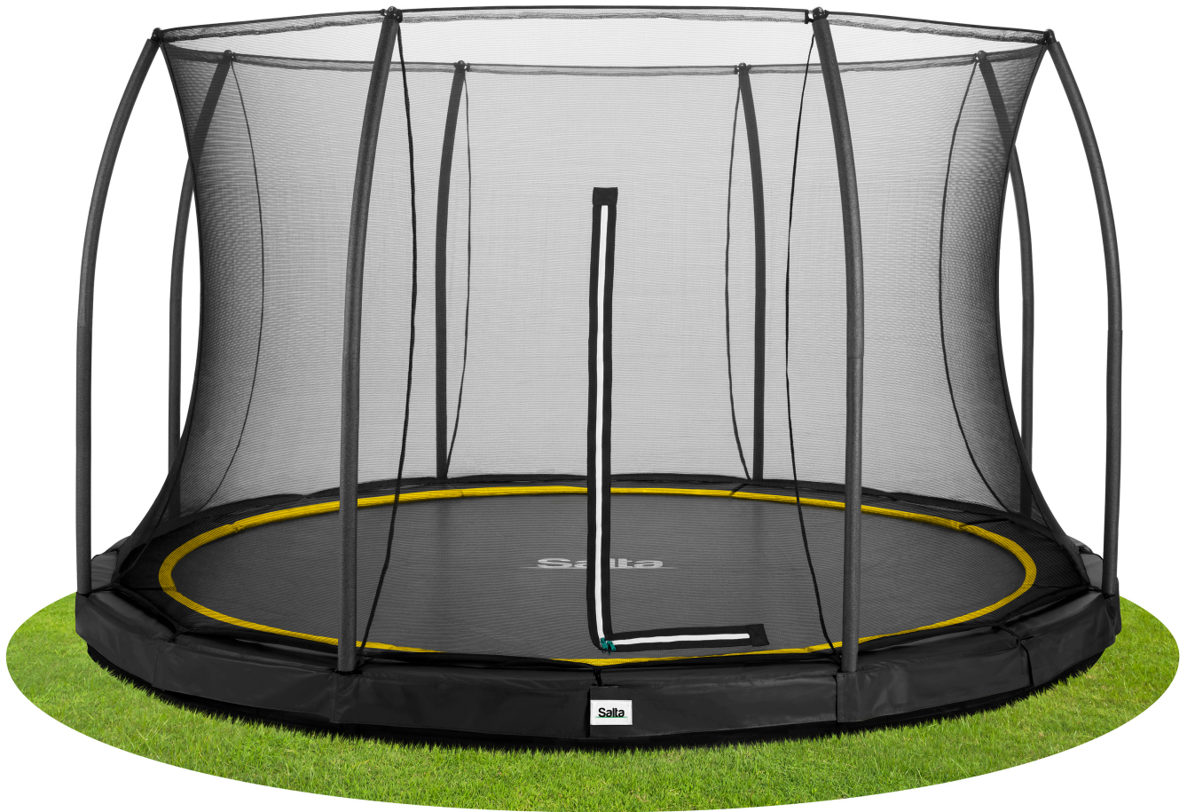
Salta Trampolin Comfort Edition Ground 5396A