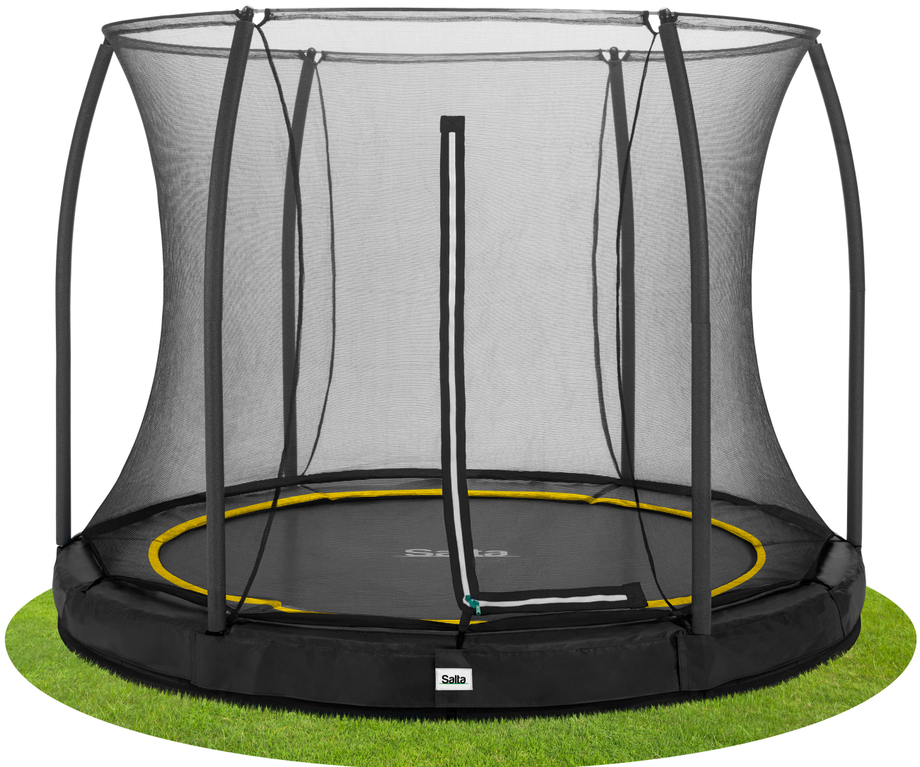
Salta Trampolin Comfort Edition Ground 5391A