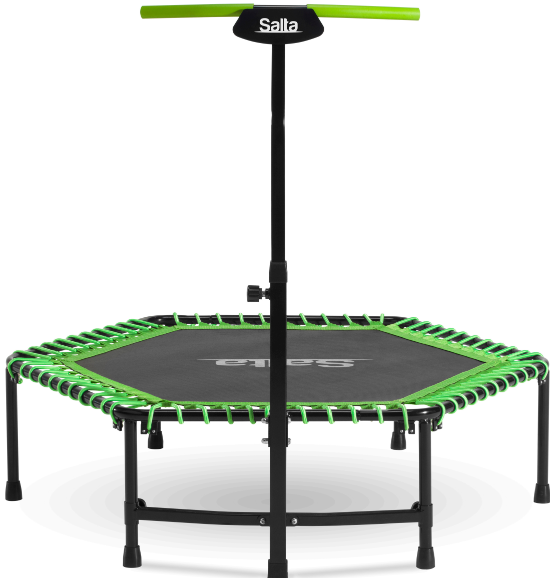
Salta Fitness Trampolin 5357G