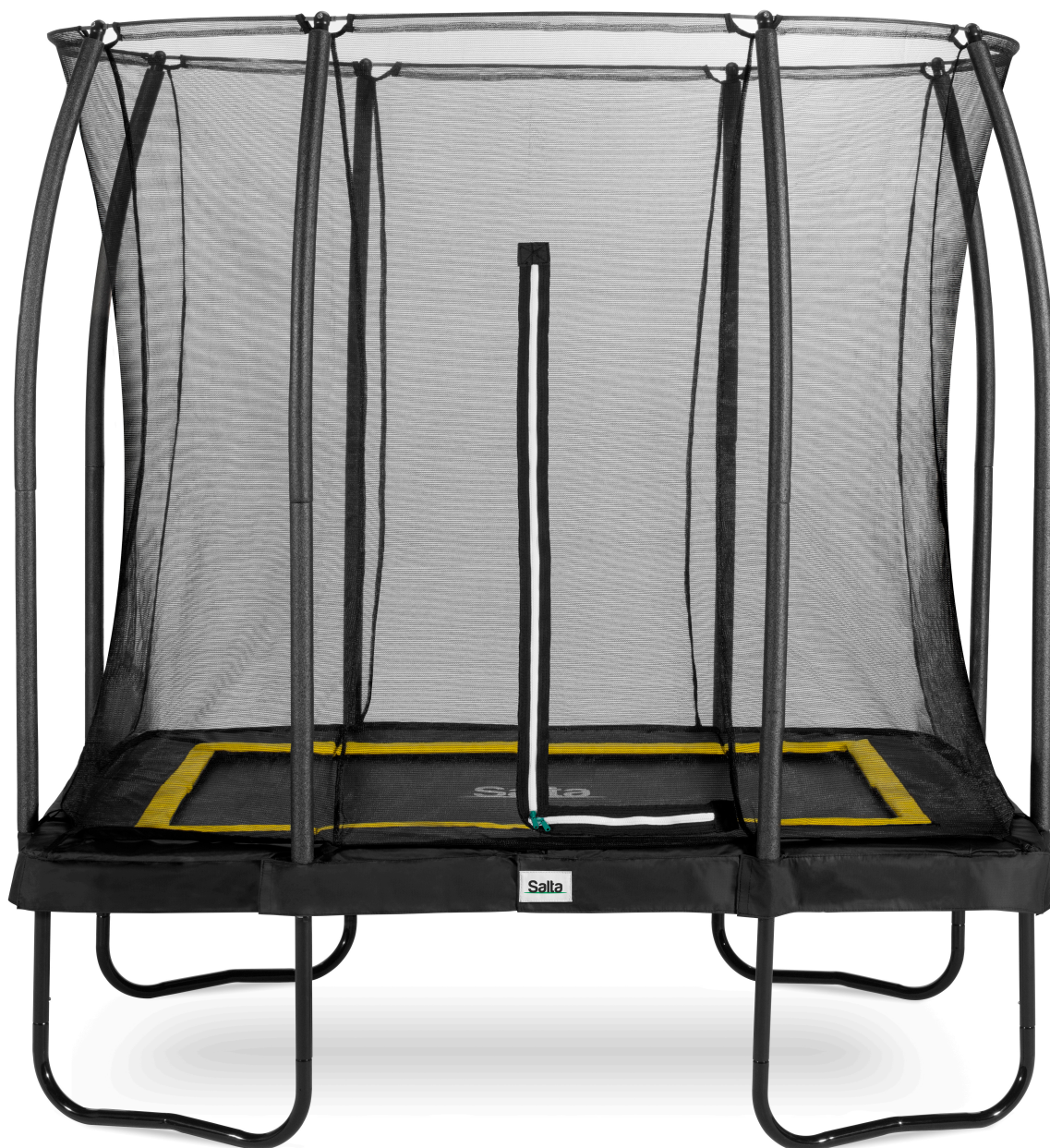
Salta Trampolin Comfort Edition 5091A