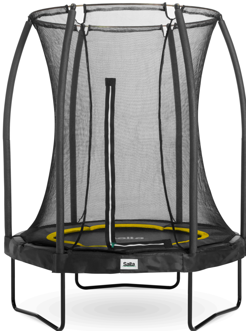
Salta Trampolin 5070A-schwarzV1