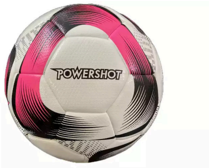
Hybrid Futsal Ball Größe: 5, FTZLFA092