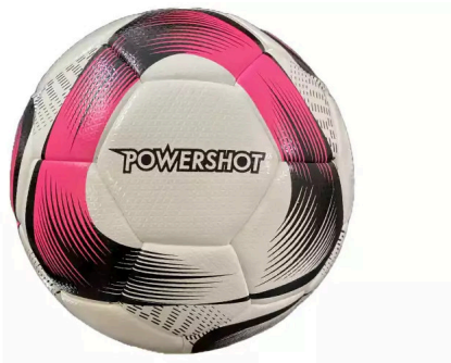
Hybrid Futsal Ball Größe: 5, FTZLFA092